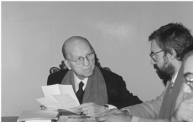
Dal Pra Presidente dell'Istituto L. Geymonat (29.XI.1991)